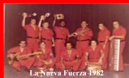
La Nueva Fuerza 1982